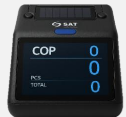
Display / Impresora