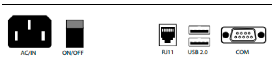
Interfaz de Comunicación

Las especificaciones están sujetas a cambios sin previo aviso. Por favor lea el manual de instrucciones cuidadosamente para asegurar el uso correcto del equipo.