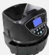
Contadoras de Monedas